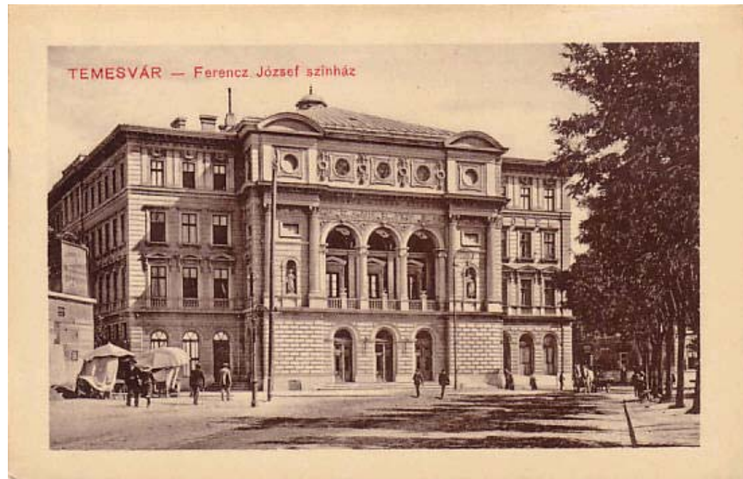
2. Ábra. A Temesvári Ferenc József színház (1800-as évek végén)

A felsőfokú oktatástól eltekintve, mely sajnos addig a pillanatig nem alakult ki, Temesváron 49 tanügyi intézmény működött, így a lakosság 80%-a minimum 6 osztályt végzett. A beindítani kívánt műszaki egyetem a második lett volna a Budapesti Műszaki Egyetem (1782) után.