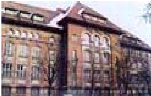
4. ábra. A Temesvári „Politehnică” Főiskola első épülete (“Școala Politehnică” din Timișoara) (a mai Gépészmérnöki Kar székhelye)